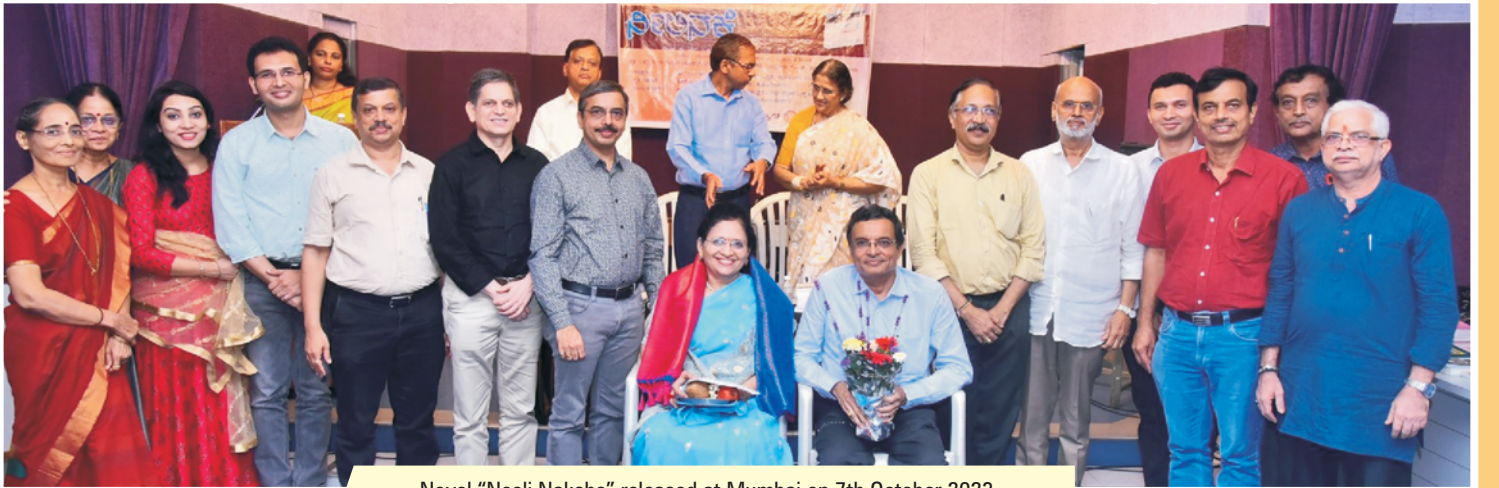
Novel "Neeli Nakshe" released at Mumbai on 7th October 2023