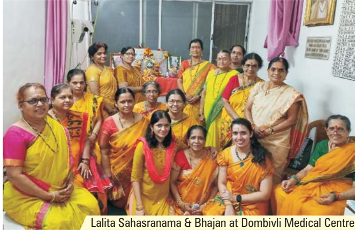
Lalita Sahasranama & Bhajan at Dombivli Medical Centre