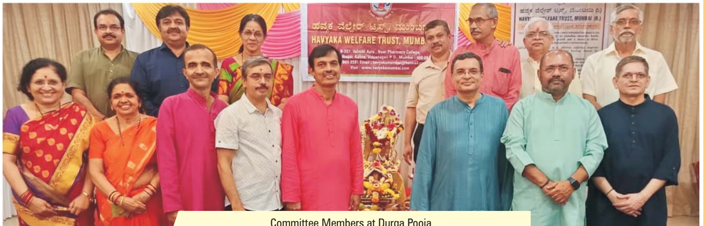
Committee Members at Durga Pooja