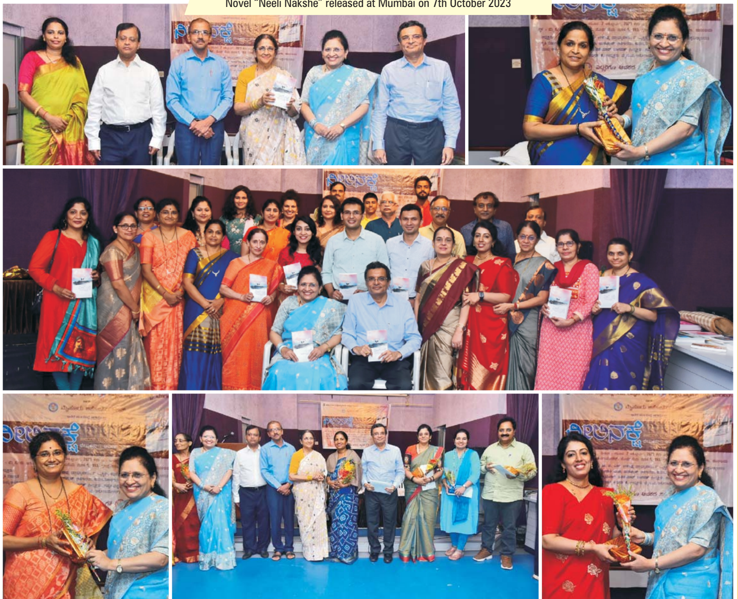
Novel "Neeli Nakshe" released at Mumbai on 7th October 2023