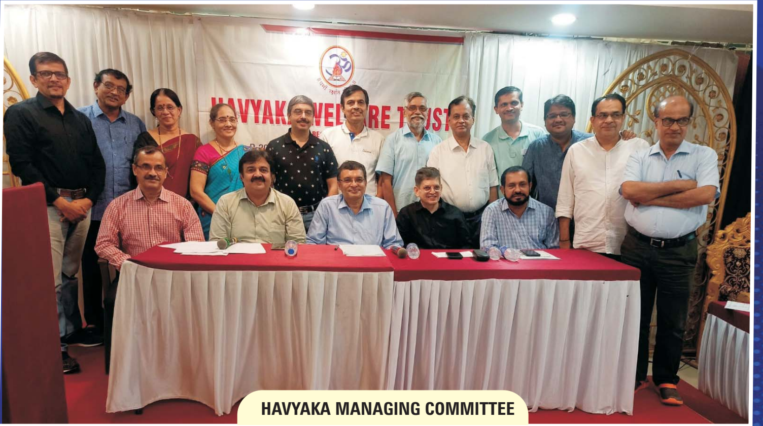
HAVYAKA MANAGING COMMITTEE